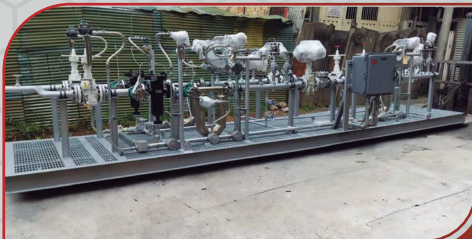
Unidad de medición de GLP ANSI 300

Suministro de sistemas de tuberías para unidades de medición, unidades LACT, Manifolds, etc.