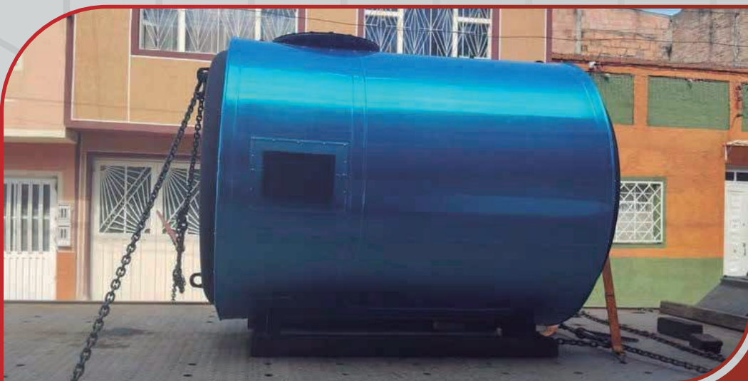
Tanque según API 12F