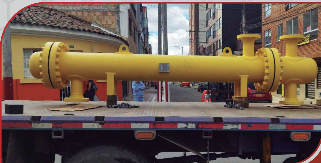
Intercambiador de calor tipo BEM de 16" Rating 600