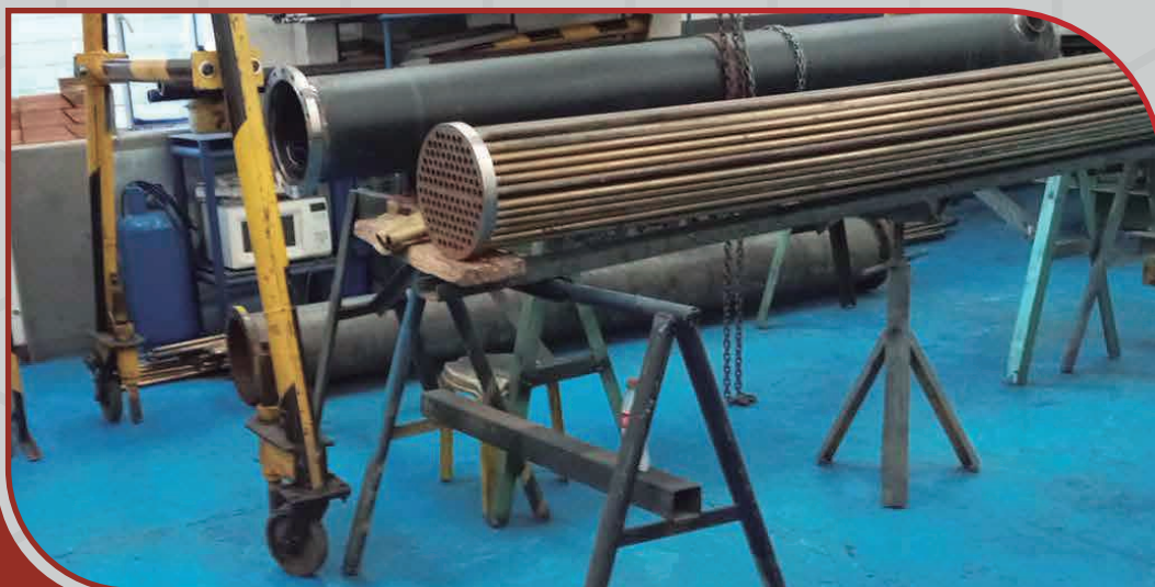
Cambio de haz tubular